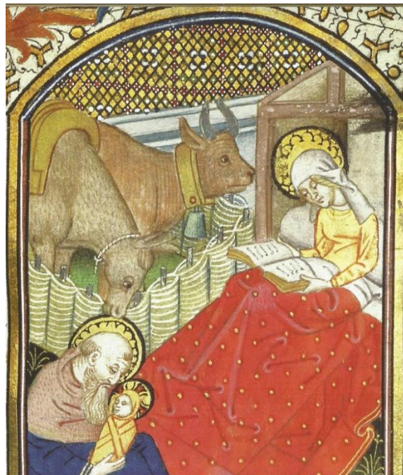
aus dem "Stundenbuch von Besancon", 15. JH

Gott, ich danke dir für die Menschen, die mir Heimat ermöglichen und mir ein Dach für Leib und Seele schenken. Sie geben mir das Wichtigste. Sie sind meine Familie.