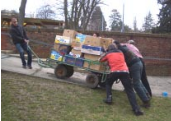
Antransport von mehr als 100 Bananenschachteln....

Großer Andrang an Kunden herrschte wie immer bei der Eröffnung vor dem Pfarrzentrum. Nicht so jedoch für das Einrichten des Pfarrzentrums in der Woche davor - hier mussten zu unseren zwei tüchtigen Männern aus der Pfarre zusätzlich fünf weitere Helfer "angeheuert" werden.