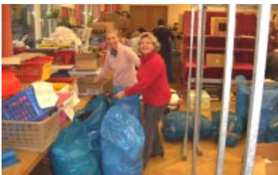
.... und Einpacken der Reste zum Abtransport