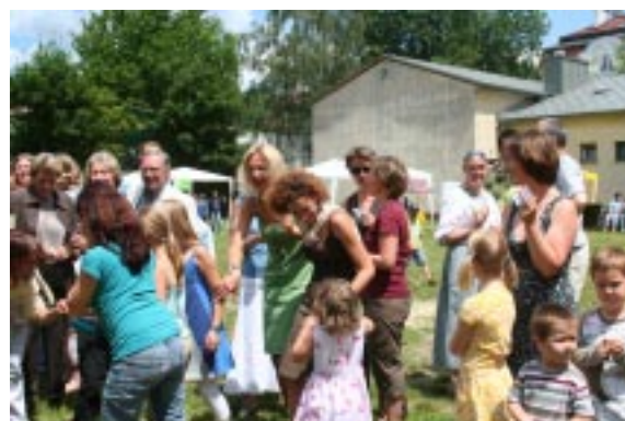
Die Menge in Erwartung des Hauptgewinns