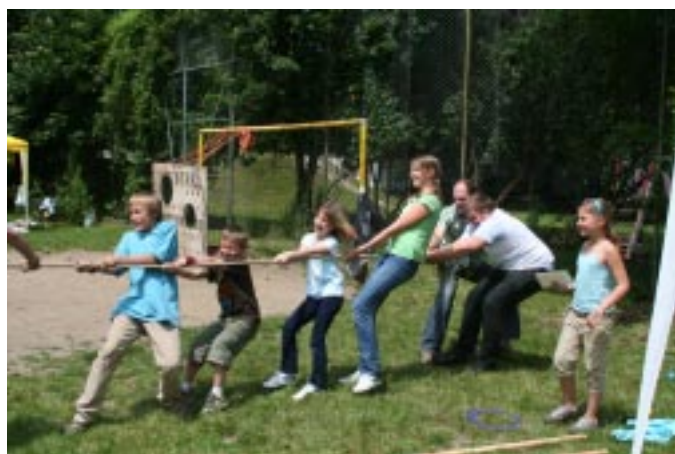
Alle ziehen an einem Strang