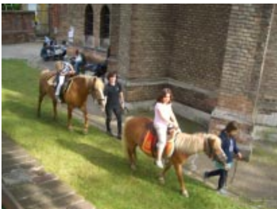
Begeisterte Kinder: auf Ponyrücken umrunden sie die Kirche