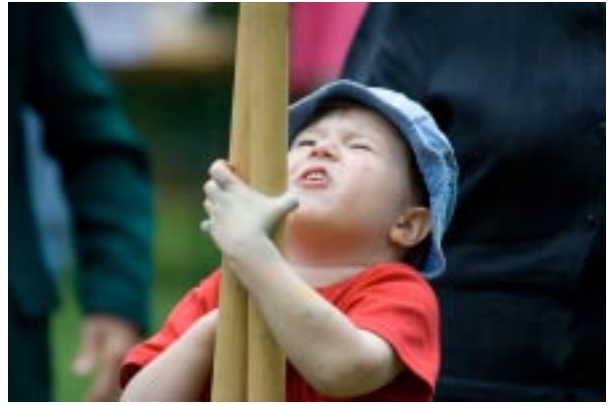
Die kleinen Erfolge .....