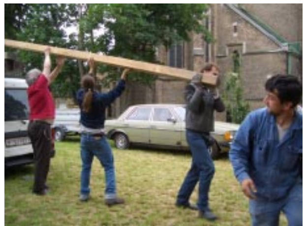
Die Konstruktionsteile für den Tanzboden werden ausgeladen