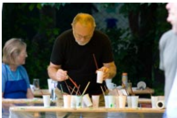
In der Malwerkstatt beim Farbenmischen