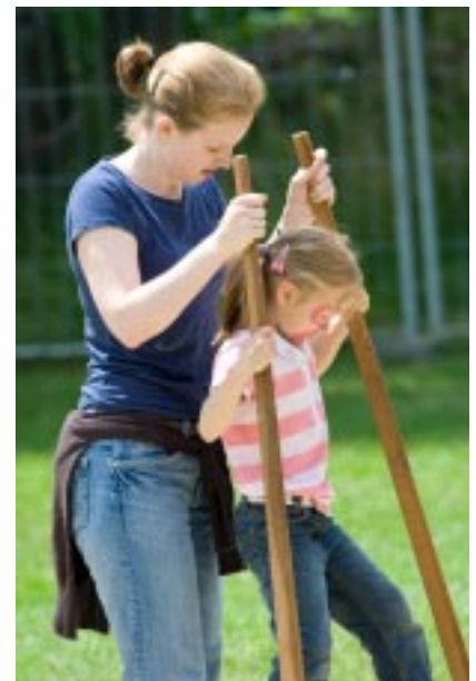
Und ich passe auf !