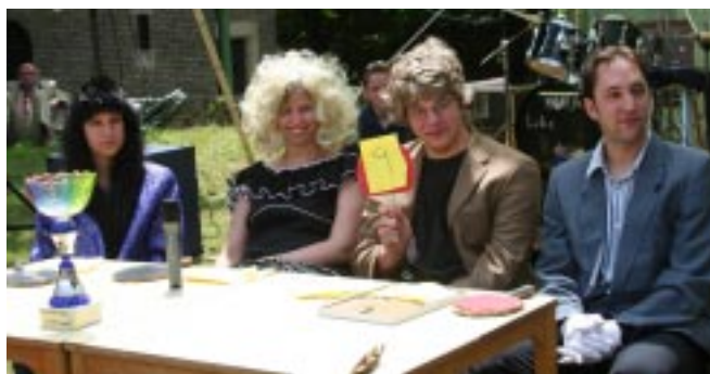
Pokal und Jury für die Dancing Stars