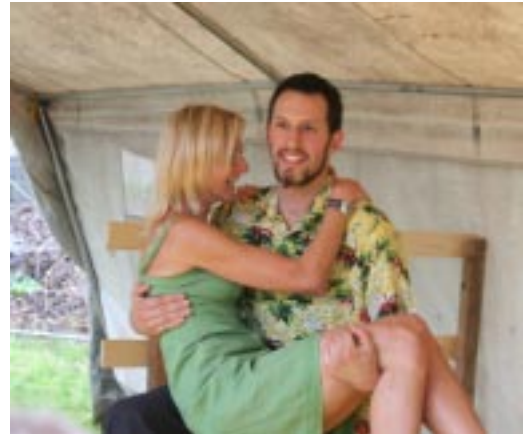
..... und die großen!