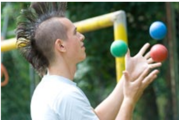
Groß und Klein zeigen, was sie können