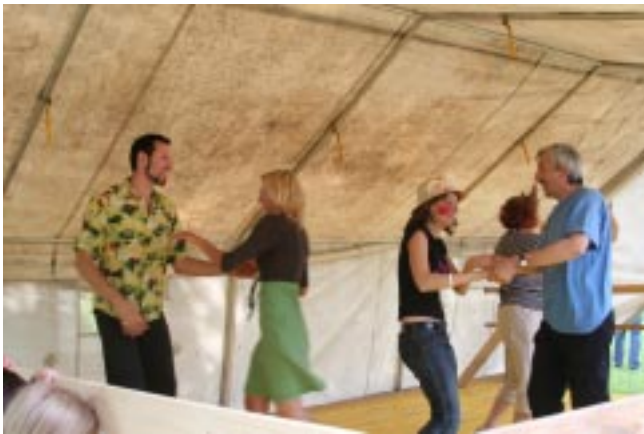
Abschlussanz der Stars