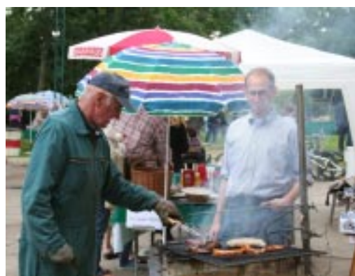
Der beliebte Würstelbrater