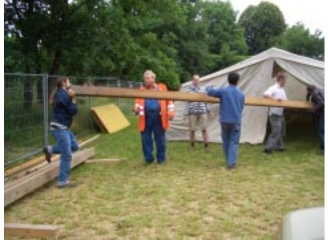
Die Vorbereitungen beginnen

PS. Beim Wiesenfest vergessene Gegenstände können in der Pfarrkanzlei abgeholt werden.