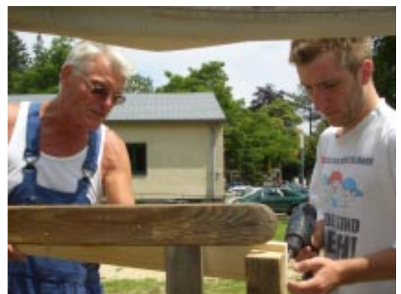
Befestigung des Geländers